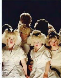
En tout, 85 séances ouvertes évidemment à tous (sous-titrage, audio-description...).

Compétitions, conférences, exposition. Pour cette 7 e édition, 11 longs-métrages et 36 courts-métrages sont au programme, ainsi que 21 capsules de deux minutes, réalisées dans le cadre du concours Fais ton court ! Outre les projections en compétition dans les trois salles du Delta, le festival propose des débats et des rencontres, mais aussi des conférences.