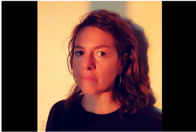
Véronique Jadin sera l'une des membres du jury de cette édition 2023.