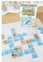
Les joueurs coopèrent pour créer une grille de mots fléchés.

Les jeux d'associations d'idées ont la cote et quand ils sont bien édités, on ne peut que succomber. Perfect Words mélange les genres ludiques avec style.