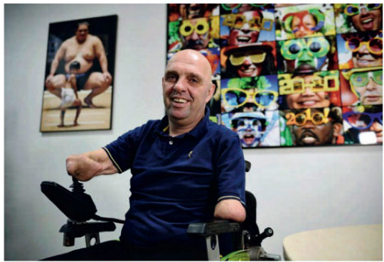
Philippe Croizon a été amputé des quatre membres après avoir été électrocuté en 1994.

Quels sont aujourd'hui vos objectifs et vos rêves? Entre un livre, continuer mes émissions de télé et de radio, retourner sur le Rallye-Raid du Dakar avec un véhicule à hydrogène, mais j'ai envie aussi de trouver des spon-